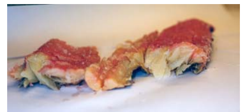
Bilde 3: Fullsaltet fisk med naturlig forekommende røde halofile bakterier. Fisken var ikke synlig misfarget ved mottak, men utviklet intens rød farge på overflaten etter en uke ved 37 °C. Fisken ble revet fra hverandre rett før fotografering.