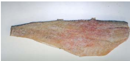
Bilde 1: Fullsaltet fisk med rød og brun misfarging av halofile og osmofile mikrober.

For ytterligere informasjon, kontakt: taran.skjerdal@vetinst.no