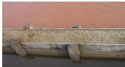
Bilde 2: Fra et anlegg for saltproduksjon i Slovenia. Veggen skiller to kammer med sjøvann. Kammeret med sterkest farge har høyest saltkonsentrasjon.